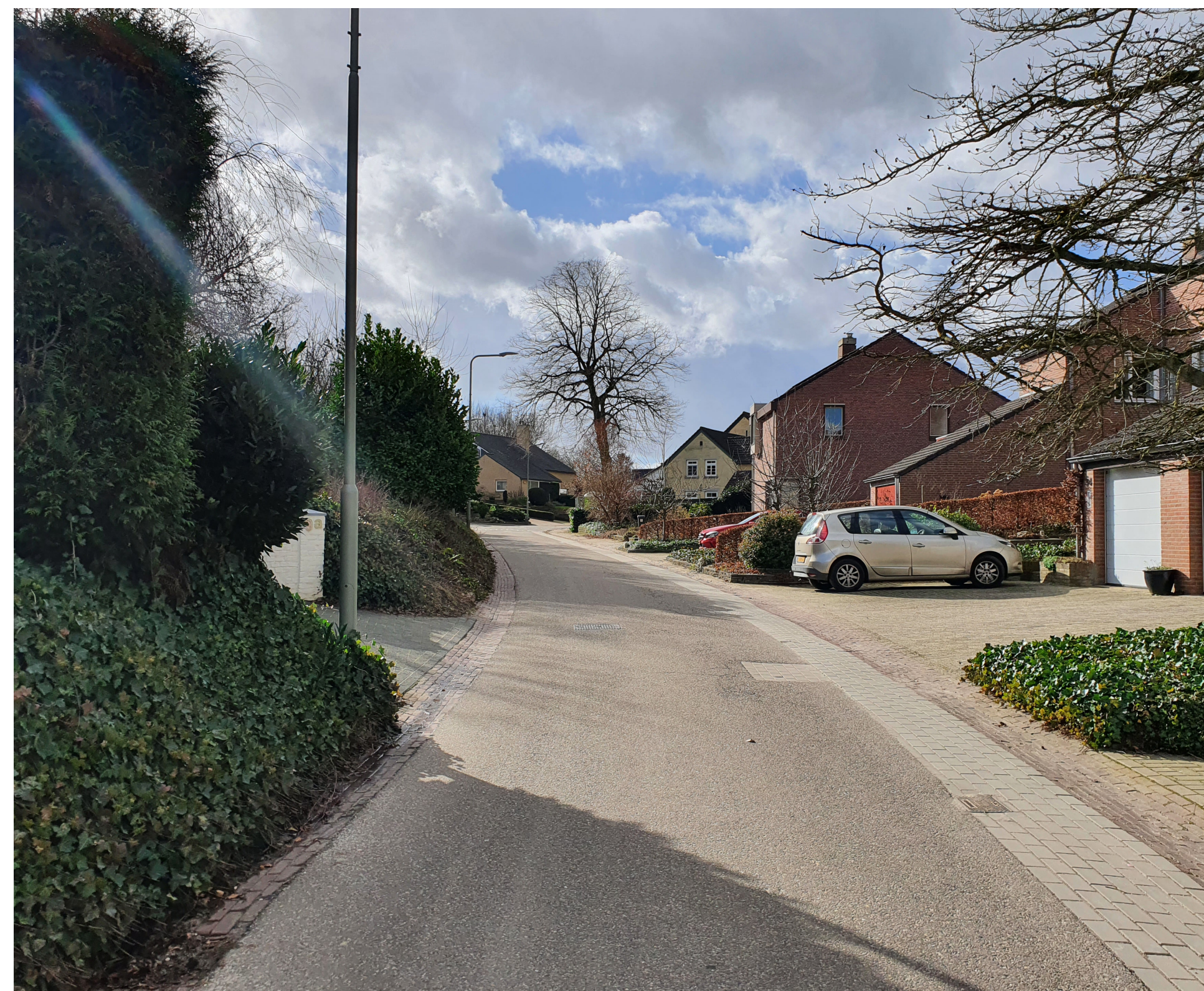
Het straatprofiel in Terblijt is te smal voor een bomenstructuur. De groene voortuinen en bomen in de tuinen dragen bij aan het groene straatbeeld.

Het straatprofiel in Terblijt is te smal voor een begeleidende bomenstructuur. De groene voortuinen dragen bij aan een groen straatbeeld. Bewoners moeten gestimuleerd worden om hun groene voortuin te behouden en bewoners die geen groene voortuin hebben moeten gestimuleerd worden deze aan te leggen.