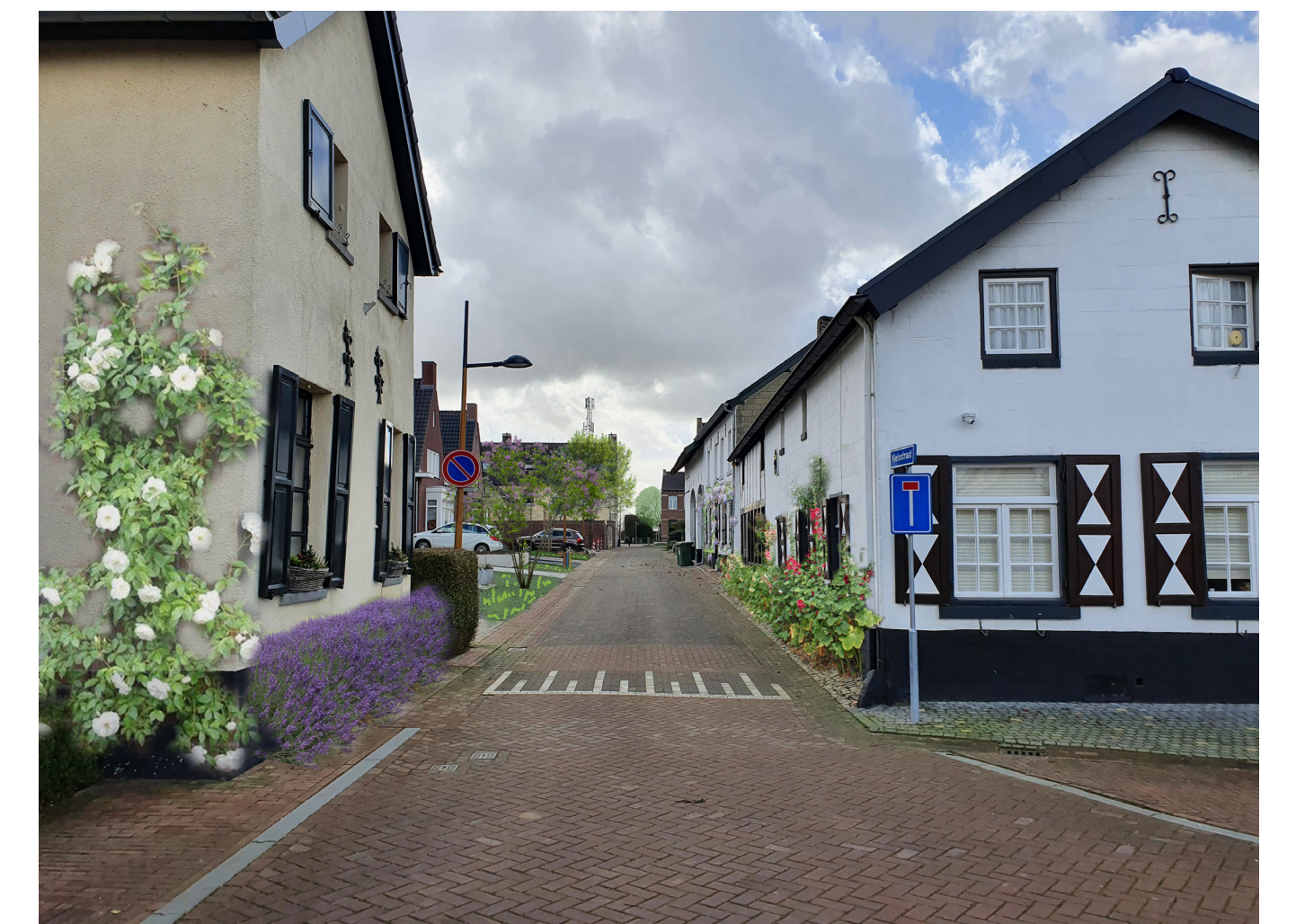
Sfeerimpressie van het toepassen van geveltuinen / gevelgroen in de Kleinstraat.