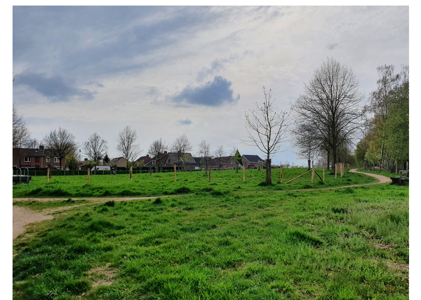
De boomgaard aan de rand van Vilt; op initiatief van bewoners aangelegd.