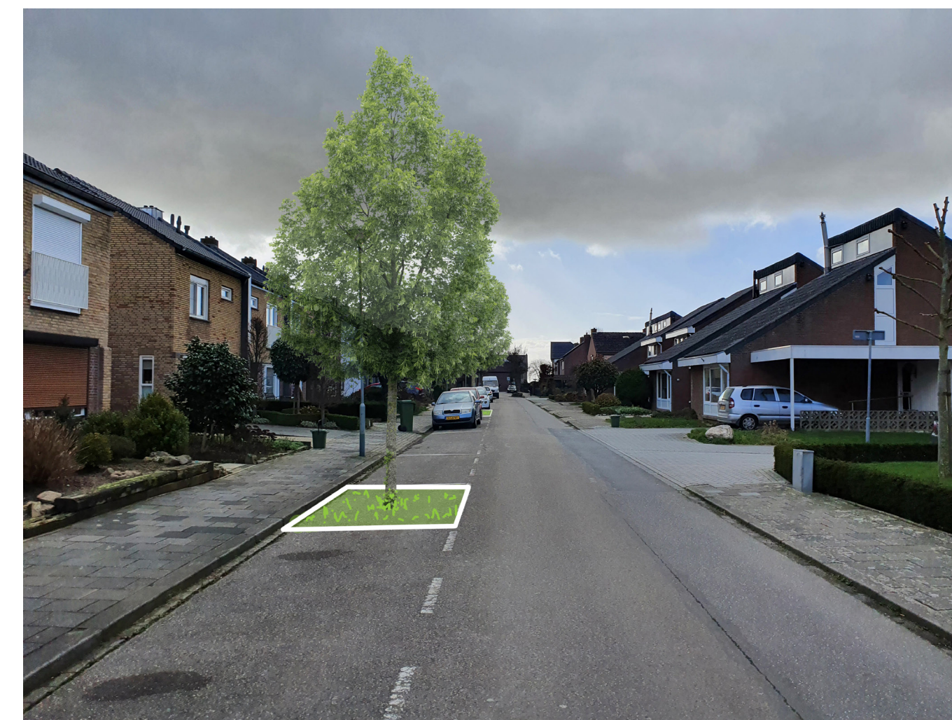
Sfeerimpressie van het toepassen van enkele bomen in een versteende straat.