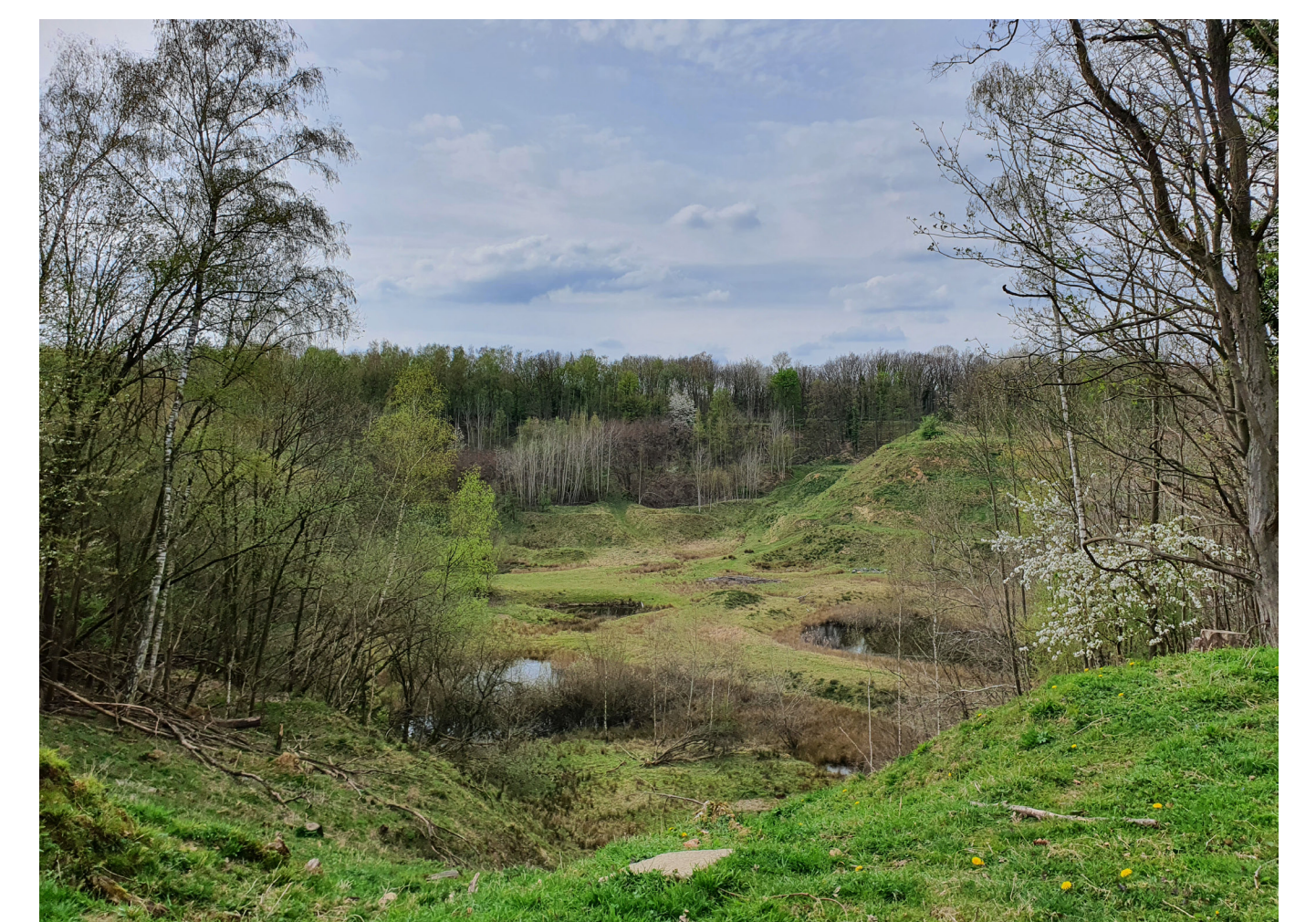
Het fraaie uitzichtpunt in de groeve bij Vilt; op initiatief van bewoners gemaakt.