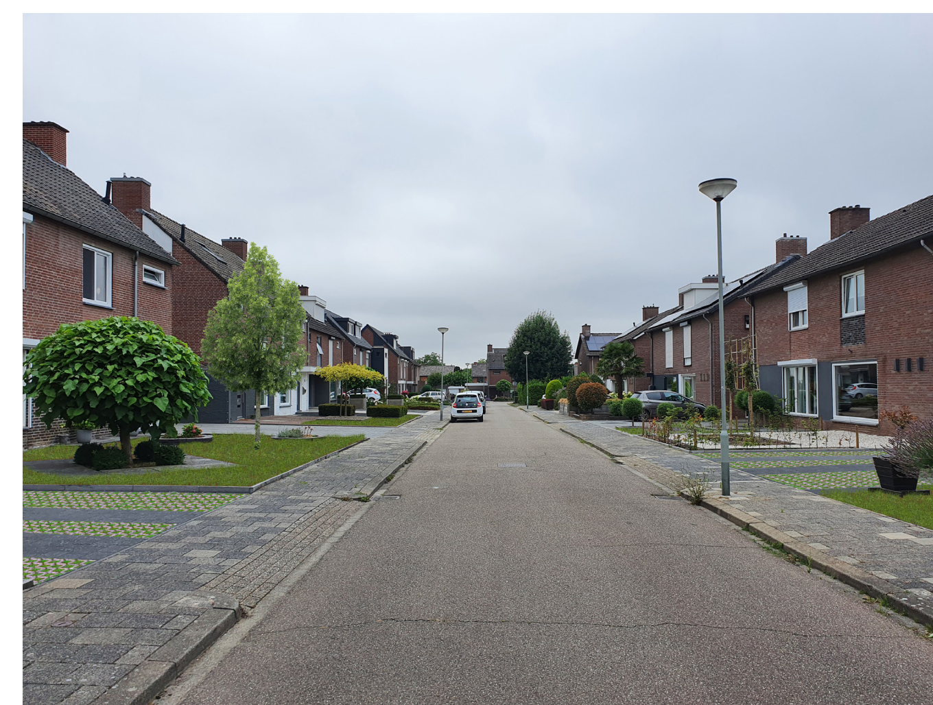
Sfeerimpressie van het vergroenen van voortuinen.