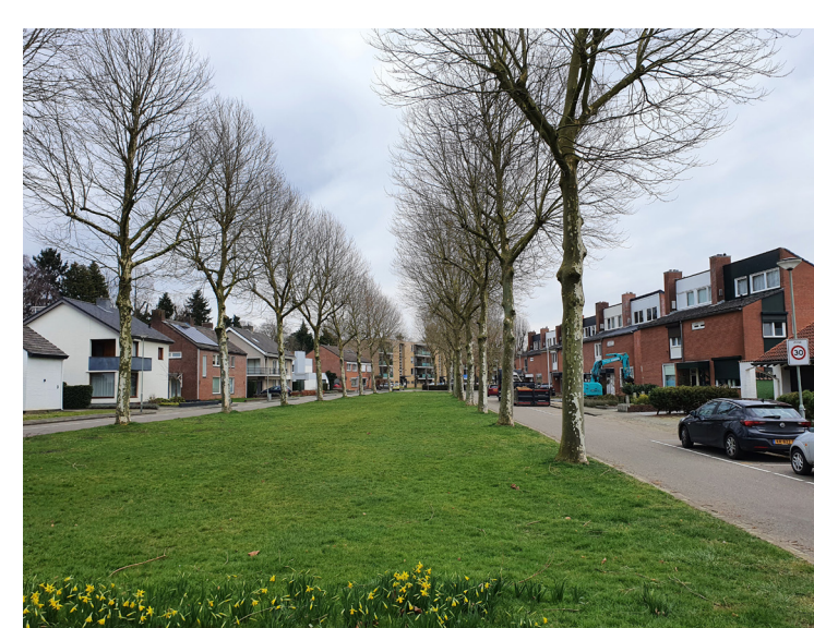
In Broekhem zijn veel van deze monumentaal opgezette bomenstructuren aanwezig. Deze platanen hebben weinig ecologische waarde en hebben dus alleen een esthetische waarde.