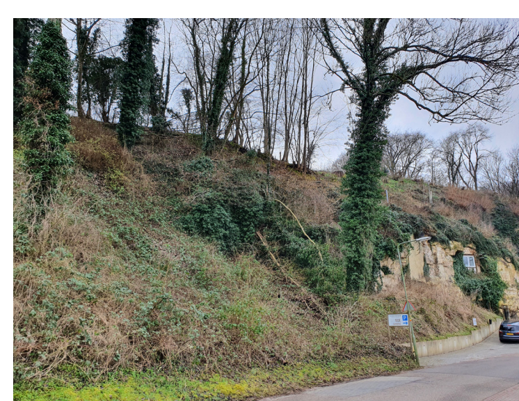
Op verschillende plekken in de gemeente zijn steile mergelwanden aanwezig. Op de foto de Wolfsdriesweg.