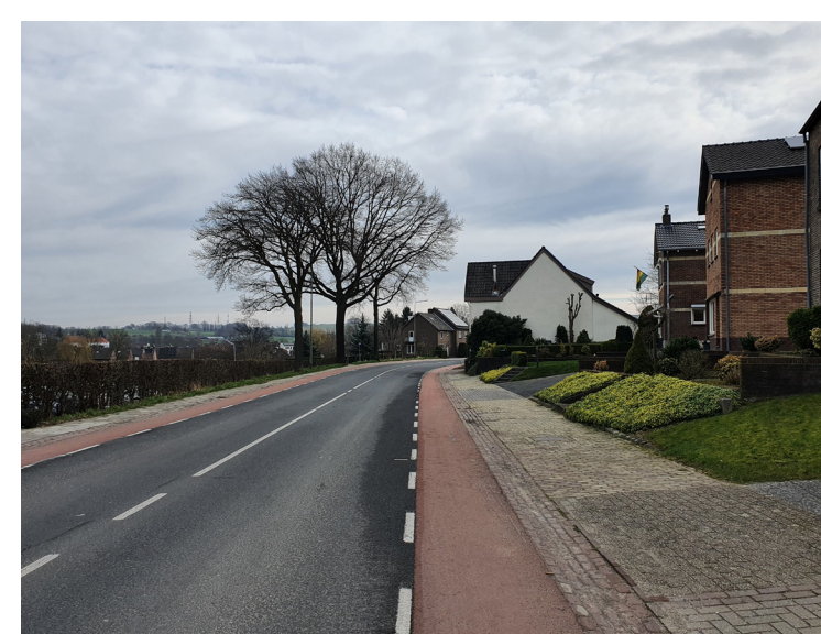
Langs de provinciale weg NS95 zijn enkel nog wat overblijfsels van de vroegere groenstructuur aanwezig. De weg oogt hierdoor vaak kaal.