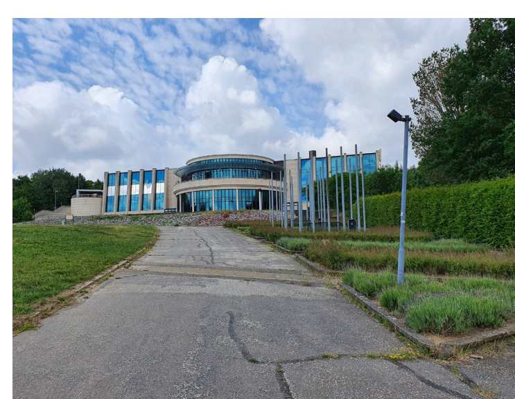
Het Kuurspark en het casino zijn destijds met veel grandeur ontworpen. Deze ontwerpgedachte past niet meer bij de huidige tijd. Daarbij is het onderhoud van het park kostig door aanwezigheid van wilde zwingen.