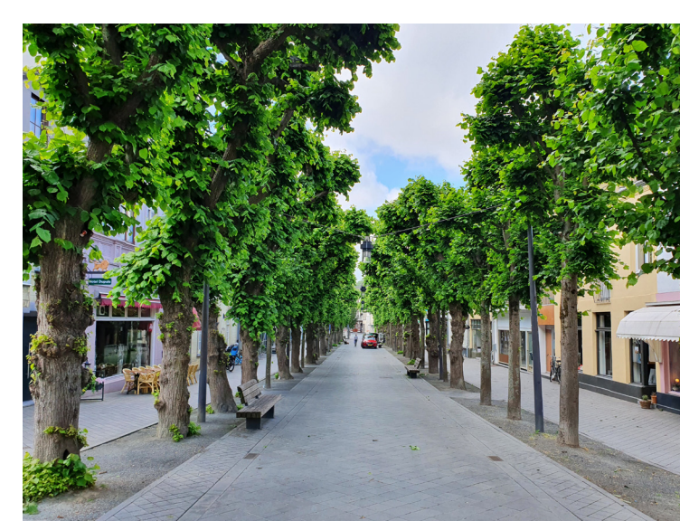
In het historische centrum van Valkenburg zijn prachtige bomenstructuren aanwezig. Op de foto staat de Lindenlaan.

Om nieuw groenbeleid te schrijven is het noodzakelijk om te starten met het analyseren van de huidige groenstructuur in de gemeente.