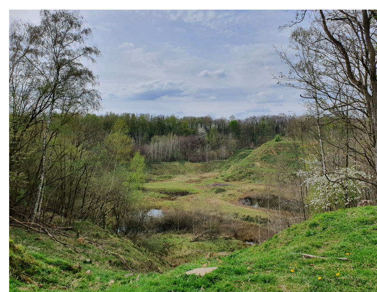
Aan de rand van Vilt is een prachtig uitzichtpunt in de voormalige groeve.