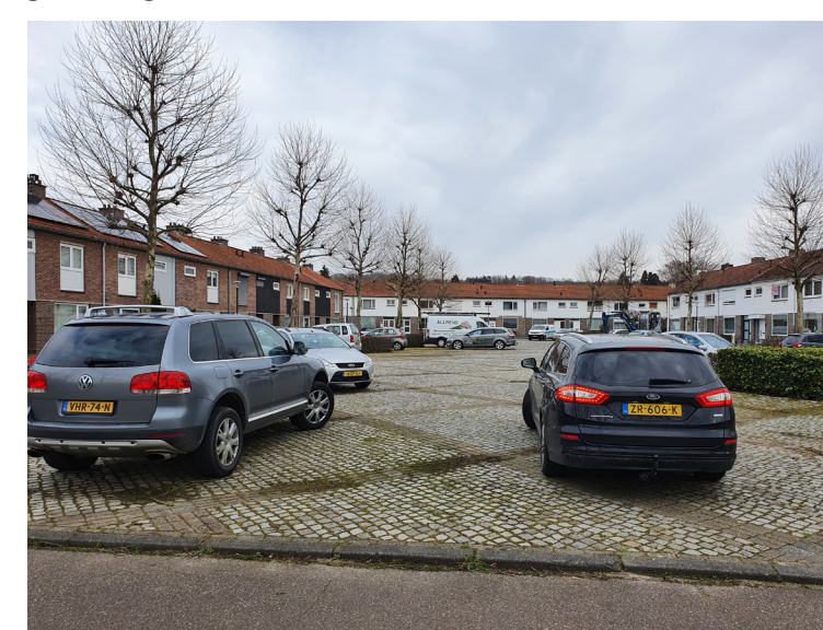
Het Sint Gerlachplein in Houthem is erg versteend en kent een oubollige groenstructuur.