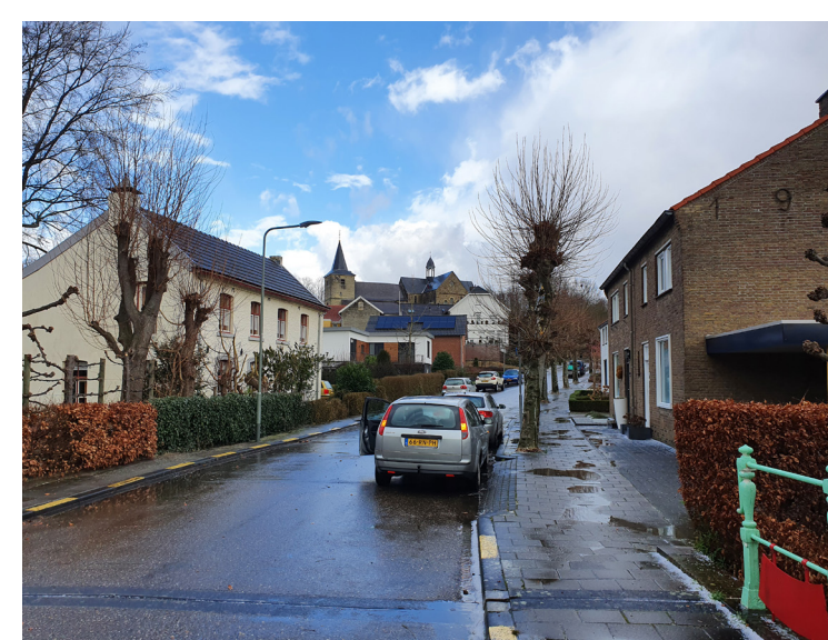
De platanen in Schin op Geul staan veelal onhandig gepositioneerd waardoor de doorgang op de trottoirs belemmerd wordt. Op de foto de Breeweg.