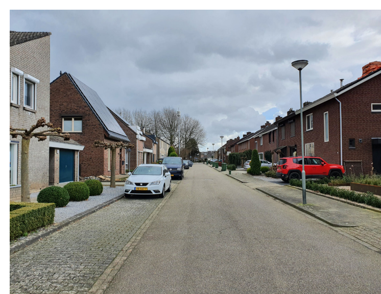
Veel woonstraten in de gemeente zijn erg versteend. Versteende voortuinen versterken dit effect. Op de foto de Heiweg in Vilt.