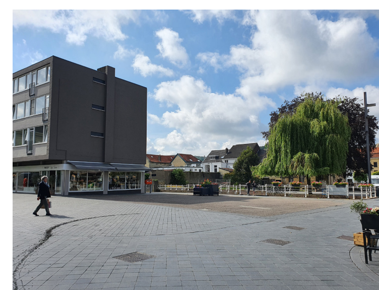
Sommige delen van het oude centrum in Valkenburg, waaronder het Theo Dorrenplein op de foto, zijn erg versteend en daardoor gevoelig voor hittestress.