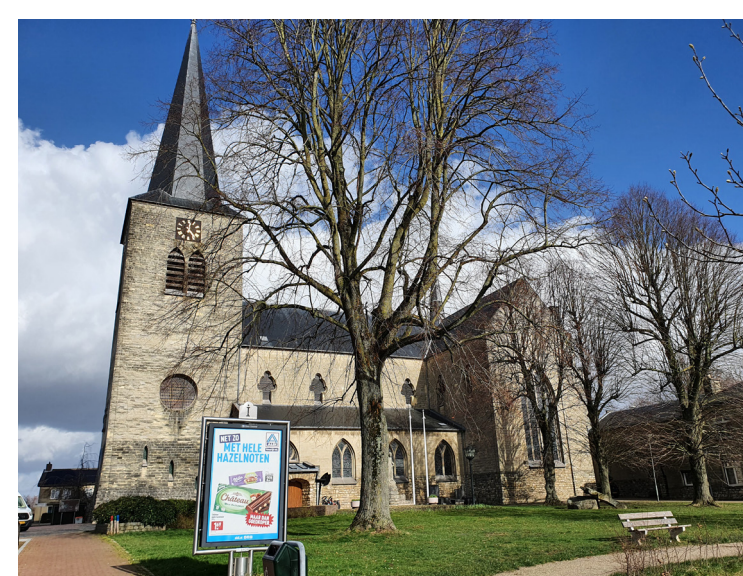
Mooi ensemble van het oude kerkgebouw en fraaie, monumentaal ogende bomen in Berg.