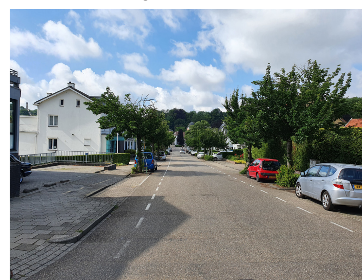
Een deel van de ontsluitingsweg rondom het centrum van Valkenburg kent een groenstructuur die niet past bij de grandeur van het oude centrum. Op de foto de Koningin Julianalaan.