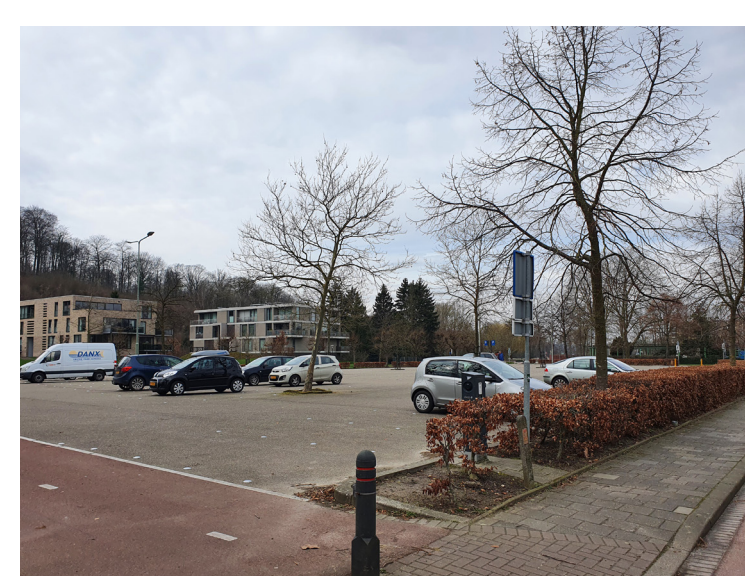
Veel parkeerplaatsen in Valkenburg hebben een versteend karakter en vormen geen fraai element in de stedelijke omgeving. Op de foto P.Odapark.