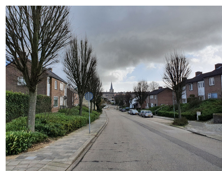
De bomen langs de Geulhemmerweg in Berg dragen sterk bij aan de herkenbaarheid van deze doorgaande route.