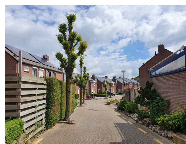
In de Beckerswei in Sibbe past de groenstructuur niet in de beschikbare ruimte. Er is wortelopdruk en de bomen worden graf gekandelaberd.