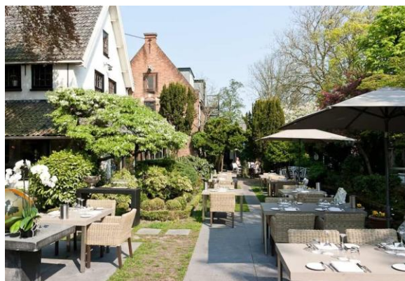
Afbeelding 3 voldoet