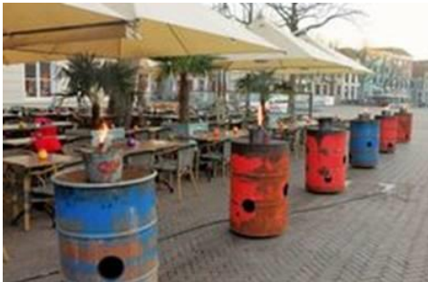
Afbeelding 13 voldoet niet

Onverminderd hetgeen hierboven is bepaald geldt dat de aankleding (bijvoorbeeld met sfeervoorwerpen) van het terras zodanig moet zijn dat deze kwalitatief en functioneel de identiteit van het bedrijf en de periode van het jaar, ondersteunt.