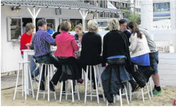
Afbeelding 5 voldoet niet