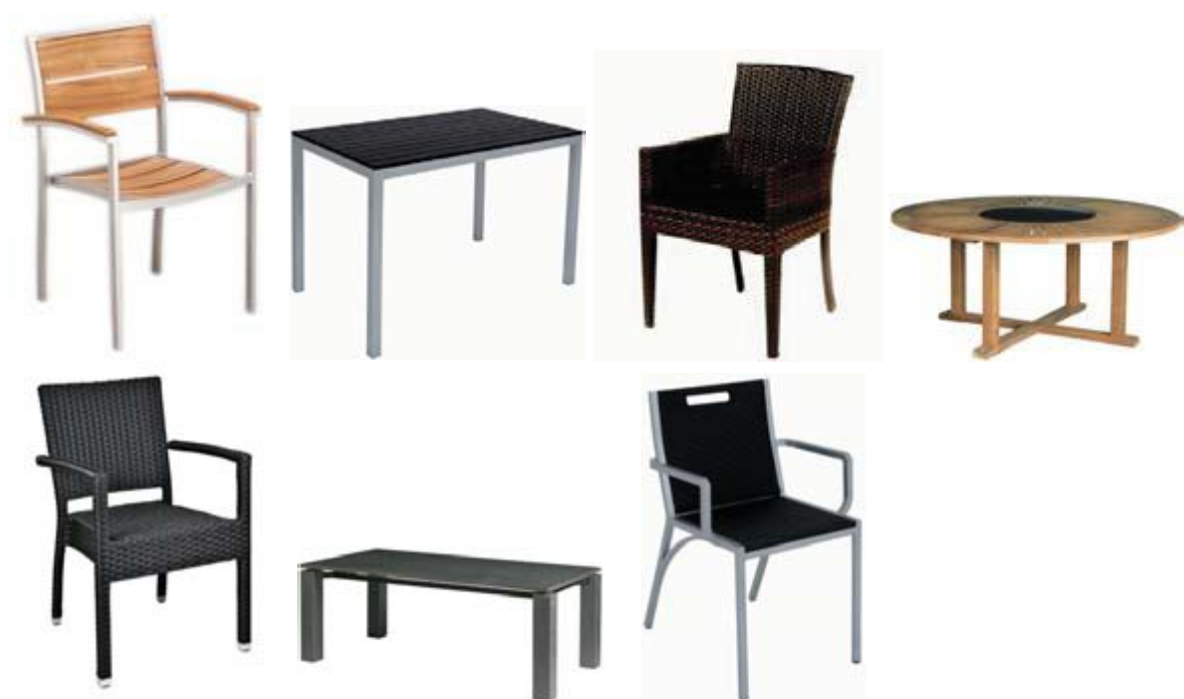
Afbeelding 9 terrasmeubilair welk voldoet aan de criteria uit het sub welstandsgebied Horeca Uitgangspunten stoelen en tafels