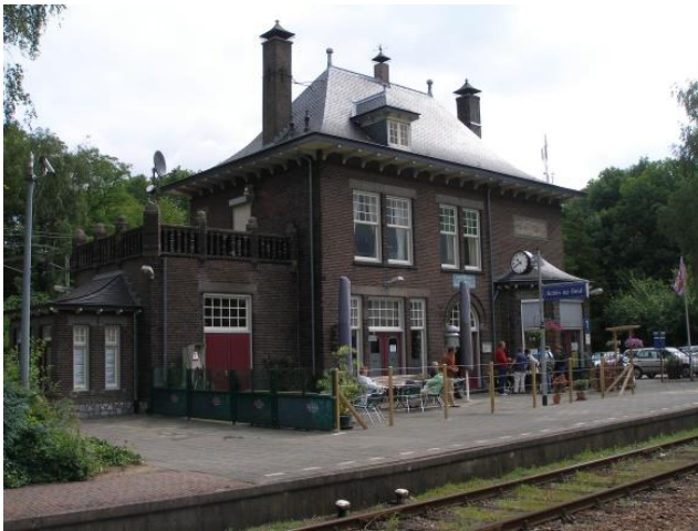
Afbeelding 1 terras bij het station Schin op Geul

Voor terrassen gelegen buiten het welstandsgebied 'centrum' die niet zichtbaar zijn vanaf de openbare weg en niet zichtbaar zijn vanaf openbare gebieden gelden geen welstandscriteria voor terrasmeubilair, parasols, vrijstaande menuborden, menustandaarden en aankleding.