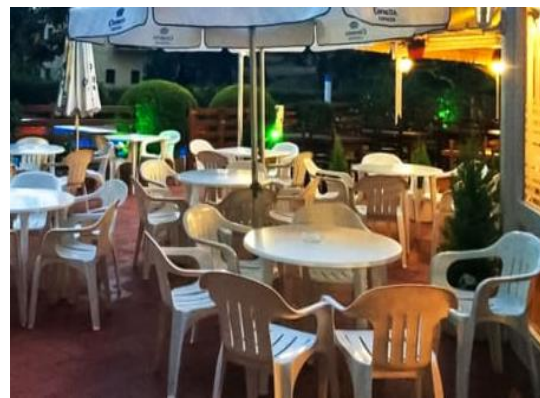
Afbeelding 8 voldoet niet

Afbeelding 5, 6, 7 en 8: de terrassen verstoren het bestaande karakteristieke beeld.