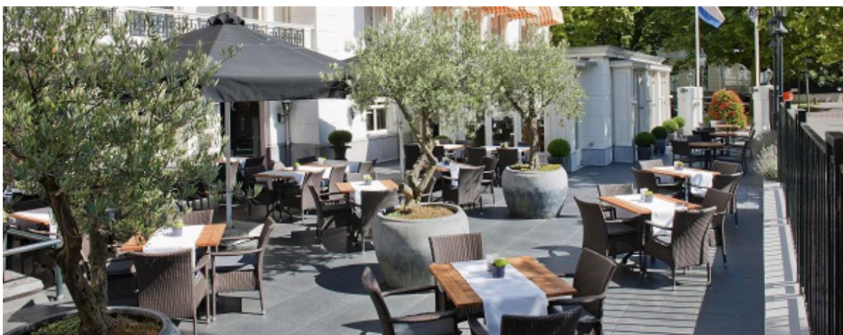
Afbeelding 4 voldoet

Afbeelding 2, 3, en 4: deze terrassen voegen sfeer, uitstraling én gezelligheid toe in de straat. De terrassen passen binnen het bestaande karakteristieke beeld.