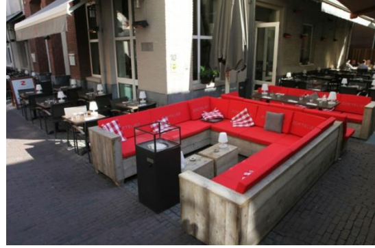
Afbeelding 6 voldoet niet