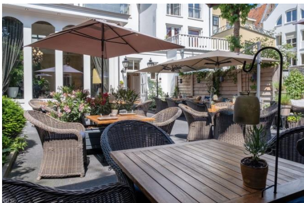
Afbeelding 2 voldoet

Met het bestaande karakteristieke beeld wordt in deze welstandsnota bedoeld: het beeld dat wordt gevormd door bouwwerken, waarvoor een vergunning voor bouwen is verleend, samen met het landschap inclusief de wegenstructuur en objecten zoals terrassen, reclames en uitstallingen die op basis van verleende vergunningen en/of op basis van beleid zijn toegestaan.