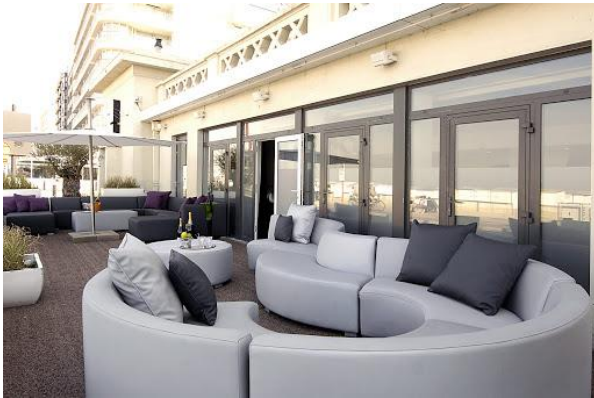
Afbeelding 7 voldoet niet