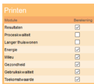
Figuur 1: Meegeleverde uitdraai GPR Gebouw