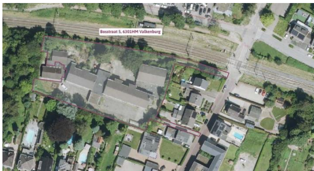
luchtfoto Bosstraat 5-5a