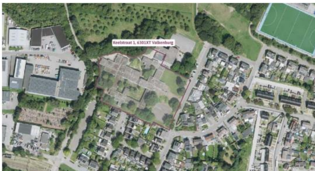
Luchtfoto locatie Keelstraat 1